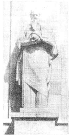
Անանիա Շիրակացու արձանը Երևանի Մեսրոպ Մաշտոցի անվ. Մատենադարանի առջև, բազալտ (1963, քանդ. Գ. Բաղասյան)