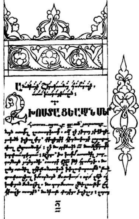
«Առ խոստացյալսն» աշխատության անվանաթերթը:

Ա. Շ. կազմել է ձայնագիտության բնագավառում իր ժամանակի չափանիշով առաջավոր ուսմունք ներկայացնող «տասնակարգյան աղյուսակի» հայկական տարբերակը, որով մեծապես հարստացրել է հայ երաժշտագիտությունը՝ ձայների, ձայնամիջոցների և ձայնաշարերի կազմությանը վերաբերող նոր գաղափարներով: Ըստ մի շարք աղբյուրների, հորինել է «քաղցրալուր» շարականներ: